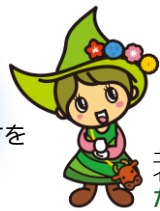
土佐れいほくイメージキャラクター たなだまいちゃん

アイデアや企画力を活かして、新しいチャレンジと一緒に取り組んでいただける方を募集しています！