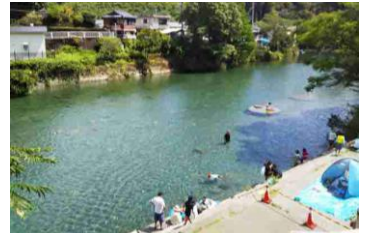
吉野川支流の清流・汗見川 夏休みは川遊び客でにぎわいます

森林率が約90%と高知県の中でも高く、山や森を身近に感じられる環境です。休日はキャンプや登山を楽しんだり、川で釣りや川遊びに繰り出す人も。夜は静寂に包まれ、夜空には星が広がります。里山での暮らしを満喫できるうえに、高知市内へ車で1時間程度と、街中へのアクセスも良好です。