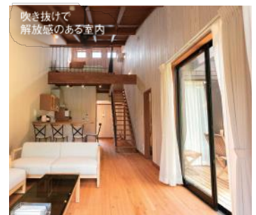
吹き抜けで解放感のある室内

※利用日によっては料金が異なる場合があります。 ※小人は4歳～小学生以下 (4歳未満は無料) ※チェックイン15:00～20:00/チェックアウト10:00