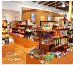
ビジターセンター